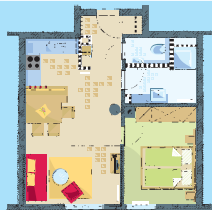
Typ 1: 43 m 2 2 Räume 1 Doppelbett