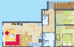
Typ 2: 57 m 2 3 Räume 1 Doppelbett 2 Einzelbetten